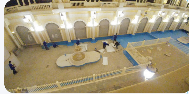
مشروع بحيرة مائية في مجمع تجاري بتليس الخرسانة بالفيبرجلاس