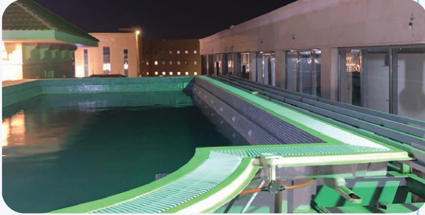
مشروع توريد وتجهيز نادي صحي بالكامل