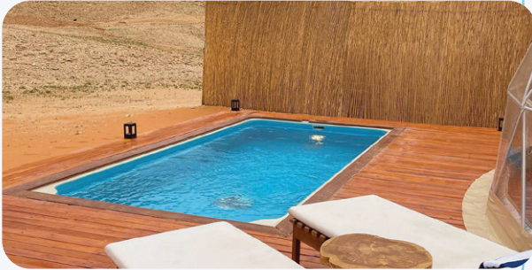
مشروع مسابح في منتجع صحراوي